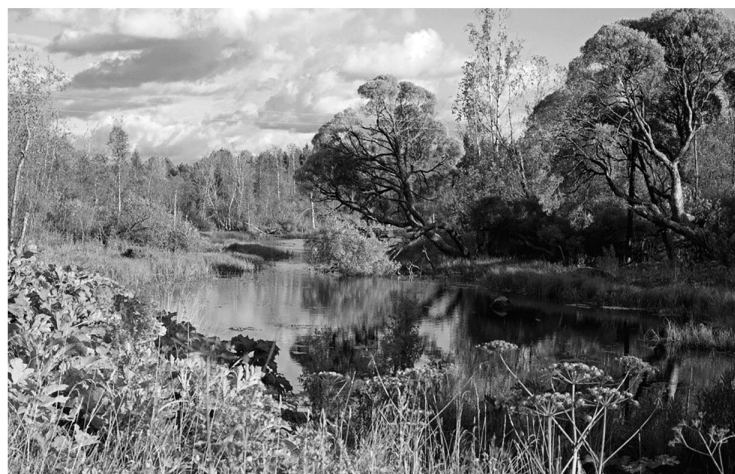
Проект «Тропа 47» объединяет свыше 40 уникальных природных маршрутов

Крупнейший терминал по производству и отгрузкам природ-