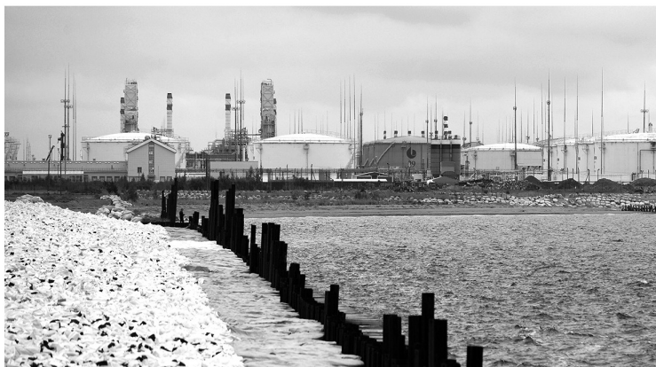
В порту Усть-Луга работают 18 морских грузовых терминалов